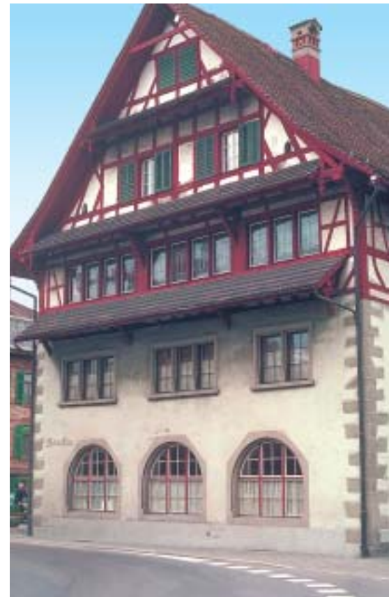
Auch historische Gebäude wie das Rathaus Baar werden mit Silikonharzfarben gestrichen. (Anstrich von 1978, Aufnahme von 1999)

Im Diagramm erkennt man folgende tendenzielle Änderungen der w-Werte: