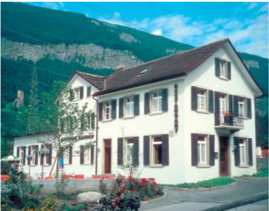
Das Restaurant Bahnhof in Haldenstein, 1982 mit Silikonfarbe gestrichen. (Aufnahme von 1999)