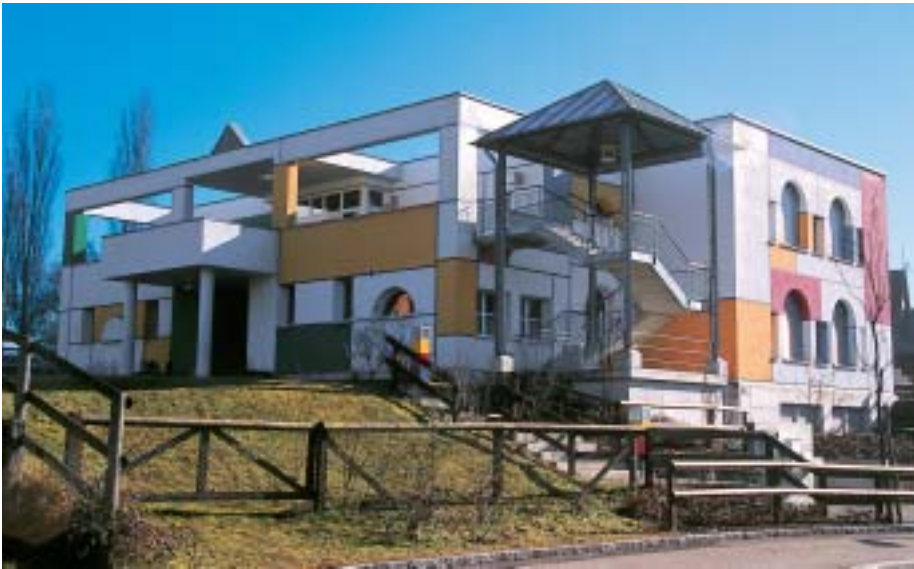
Modern gestaltetes Gebäude in Winterthur. Silikonanstrich von 1994, Aufnahme von 1997.

einen Diffusionswiderstand s_D < 0,1 \text{ m} (Einstufung: mikroporös, wasserdampfdurchlässig).