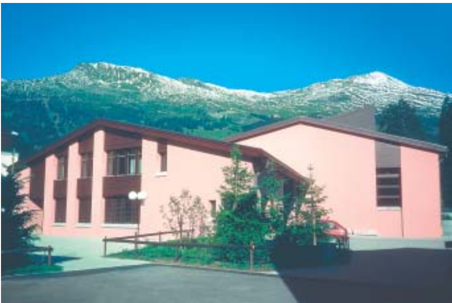
Silikonharzfarben werden häufig für Fassaden eingesetzt. Hier eine Turnhalle in Lenzerheide. Der Anstrich stammt von 1983, die Aufnahme von 1999.

Silikonharze gelten als die wasserdampfdurchlässigsten Silikonverbindungen. Die wasserabweisende Wirkung der Silikonharzfarben wird aber nicht nur durch das Silikonharz herbei-